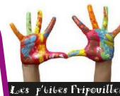
Les petites tripouilles

Coordonnées : afr.animationenfance@gmail.com 06 07 71 61 87